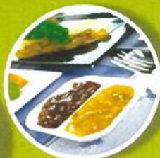
Portage de repas