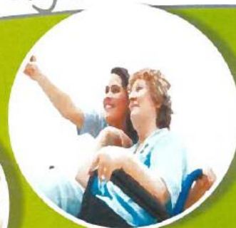
Aide à la personne