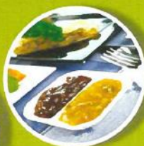
Portage de repas