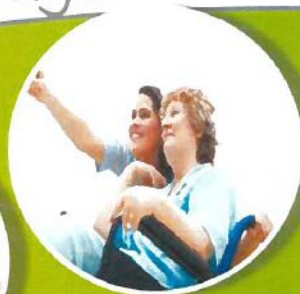
Aide à la personne