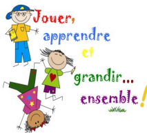
Tableau Ecole 2013/2014 par enfant

Formation de la cantonnière : Le parc organise une formation sur l'utilisation des produits phytosanitaires