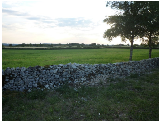
Le 16 mai : une journée animation « murets » en relation avec le Parc s'est déroulée sur le Couderc, 140 personnes ont visité le village et remonté le mur.